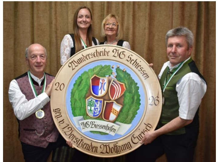
Die begehrte Wanderscheibe gewann der Schützenverein „DerRotensteiner“ Ruderatshofen.